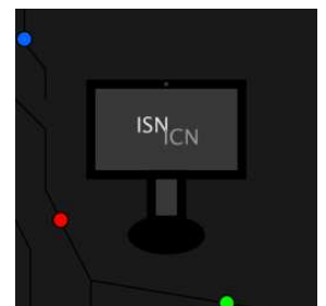
Logo programmé par un élève et choisi par ses camarades par un sondage

Par une expérience collective et partagée, les élèves passent de consommateur à concepteur , créateur et utilisateur de leurs objets informatiques (applications, œuvres, sites, analyses...).