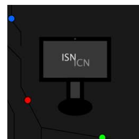
Logo programmé par un élève et choisi par ses camarades par un sondage

Par une expérience collective et partagée, les élèves passent de consommateur à concepteur , créateur et utilisateur de leurs objets informatiques (applications, œuvres, sites, analyses...).